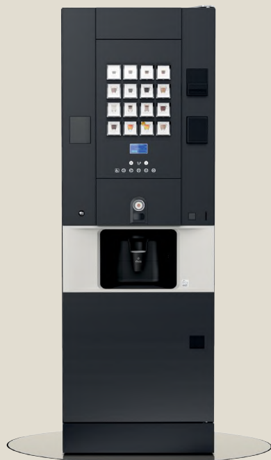
rh FS 1.buttons