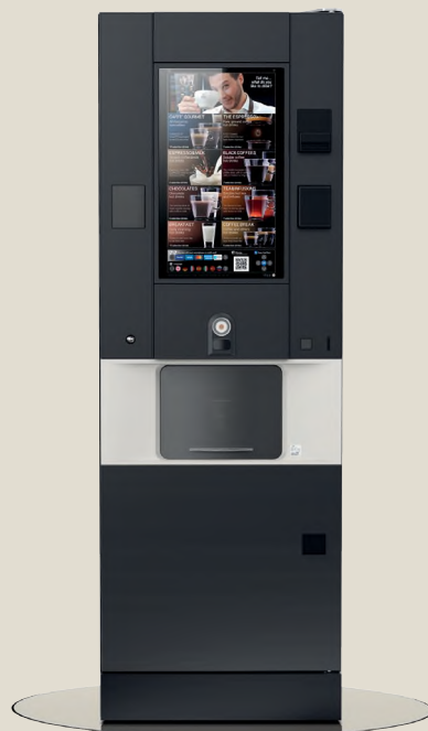
rh FS 1.touch21.5